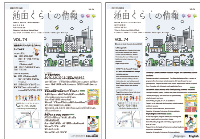
6言語で発行されている情報誌

また、市広報誌の一部を多言語化した情報誌を2か月に1回発行し、日本語カフェ参加者への配布やHP・SNSでの発信に加え、口コミによる広がり重視しています。