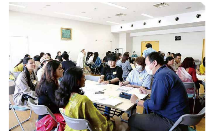
働く外国人のための交流会