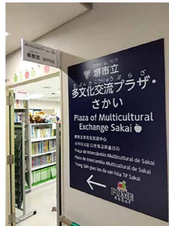
多文化交流プラザ・さかい

そのほか、「多文化交流プラザ・さかい」[愛称:POME Sakai(ポムさかい)]では外国人が必要な行政情報を理解し、適切な行政サービスを受けられるよう多言語による相談を行うほか、専門家相談やボランティア通訳派遣、分かりやすい日本語で伝える「やさしい日本語」の使用啓発、外国にルーツを持つことものの支援について考えるセミナー等を行っています。